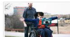
Kommunisere overalt 7. AUGUST 2024