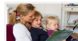
Bildebøker med grafiske symbol 5. AUGUST 2024