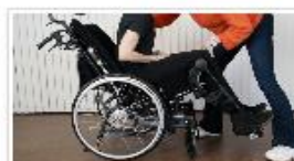
Kroppens anatomi og tilpasning til sj... 19. AUGUST 2024