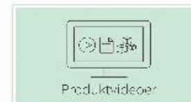
Produktvideoer Produktvideoer om arbeidsstoler 17. JUNI 2024