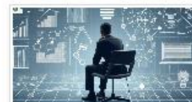
Hvordan kan KI hjelpe med produkti... 20. JUNI 2024