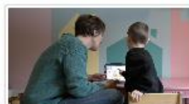
Før og etter hjelpemidler 26. JUNI 2024